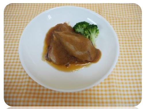
◎カツオのリンゴソース 実際に給食で出したものです。